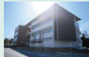
「最先端有機光エレクトロニクス研究棟」