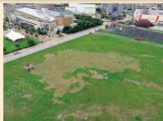
九州測量200年記念屋外ワークショップ 5000分の1の九州地図

北九州市では初めての試みでしたが、会場となった3館を中心に大学・地元の高校、北九州市を中心に活動するNPO等の協力のもと夏休みの土日2日間にわたり開催され、総入場者数は1,665人となりました。